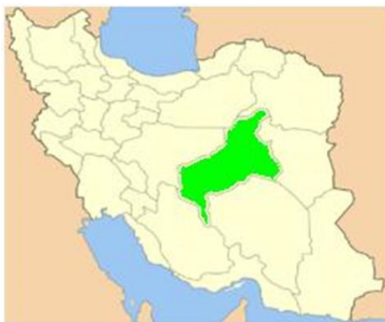
شکل ۱. موقعیت استان یزد