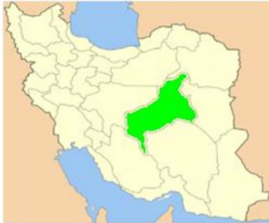
شکل ۱. موقعیت استان یزد