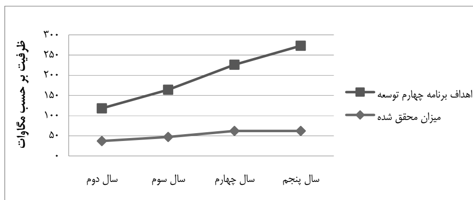
نمودار ۴: میزان تحقق اهداف برنامه چهارم توسعه در زمینه احداث عملی نیروگاه‌های تجدیدپذیر

در نمودار (۴) نیز که میزان تحقق اهداف برنامه چهارم توسعه در زمینه احداث عملی نیروگاه‌های تجدیدپذیر را به زبان ساده با استفاده از خطوط شیبدار بیان می‌کند، فاصله زیاد اهداف تعیین شده و اهداف محقق شده به وضوح مشخص است.