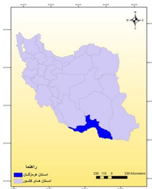
شکل ۱) تصویر موقعیت منطقه مورد مطالعه در ایران

استان هرمزگان در جنوب ایران با مساحت ۷۱ هزار کیلومتر مربع بین مختصات جغرافیایی ۲۵ درجه و ۲۴ دقیقه تا ۲۸ درجه و ۵۷ دقیقه عرض شمالی و ۵۳ درجه و ۴۱ دقیقه تا ۵۹ درجه و ۱۵ دقیقه طول شرقی از نصف النهار گرینویچ واقع شده و ۴/۶۳ درصد از وسعت ایران را به خود اختصاص داده است. طبق آخرین سرشماری ها، جمعیت کل استان ۱۴۰۳۶۷۴ نفر است که حدود ۲/۸ درصد جمعیت کشور را تشکیل داده‌اند. این استان با تراکم ۱۹/۳۷ نفر در هر کیلومتر مربع از استان‌های کم تراکم کشور به حساب می‌آید.