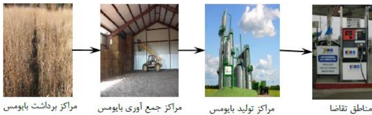
شکل ۱. ساختار زنجیره تامین سوخت زیستی

تعدادی از گزینه‌های تصمیم‌گیری و فعالیت‌های پی‌درپی از قبیل انتخاب زمین، کاشت و کوددهی، برداشت، حمل و نقل و تولید سوخت زیستی در این زنجیره وجود دارد و این تصمیمات از طریق زنجیره تامین مطرح و بررسی می‌شوند. گندم‌زار دارای بازده بالایی برای تولید بایومس است؛ با این وجود هزینه‌ی اجاره‌ی بالایی دارد. از طرفی زمان و روش کاشت به یکدیگر وابسته هستند. بنابراین نیاز است تا سناریوهای مختلف با هم در نظر گرفته شوند. برای فرآیند تصمیم‌گیری بهینه و بررسی تولید سوخت زیستی، نیاز است تا مدل‌های بهینه‌سازی یا سیستم‌های پشتیبان تصمیم‌گیری فشرده توسعه یابند.