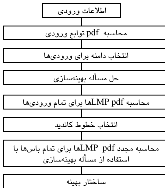
شکل ۱- ساختار روش پیشنهادی

- باسهای چاه ۴ : به عنوان مجموعه‌ای از باس‌ها که دارای بیشترین مقدار میانگین LMP (MLMP) و کمترین مقدار انحراف از معیار LMP (VLMP) می‌باشند، انتخاب می‌شوند. - خطوط کاندید مجموعه‌ای از خطوط هستند که میان هر باس چشمه و هر باس چاه ایجاد می‌شوند. مرحله ششم: با تکرار مراحل (۱ تا ۴) و با معرفی یک خط کاندید در هر مرحله VLMP, MLMP, MP, تمام باس‌های چاه محاسبه می‌شود. مرحله هفتم: بهترین طرح برای کاهش LMP هر باس چاه با توجه به کمترین مقدار MLMP و VLMP یافته می‌شود. شکل شماره (۱) ساختار روش معرفی شده را نشان می‌دهد.