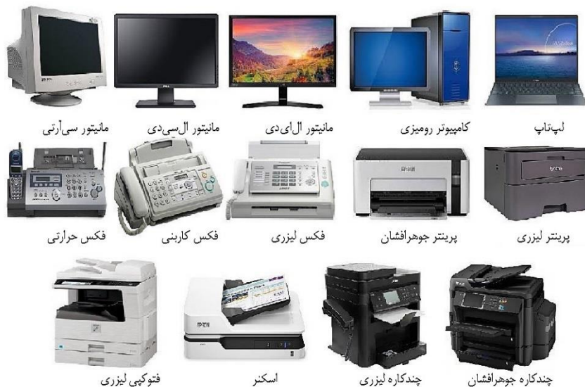
شکل ۲. تجهیزات متداول استفاده شده در ساختمان‌های اداری

تجهیزات اداری داده شده است (شیخ ۱ و دیگران، ۲۰۱۴) (چاکرابورتی و پافالزر ۲ ، ۲۰۱۱) (تمپل برد ۳ و دیگران، ۲۰۱۵).