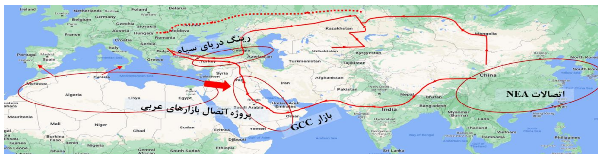
شکل ۱: نقشه برنامه جامع تبادلات انرژی بین شرق آسیا و قاره اروپا بوسیله سه پروژه NEA، GCC و STBP