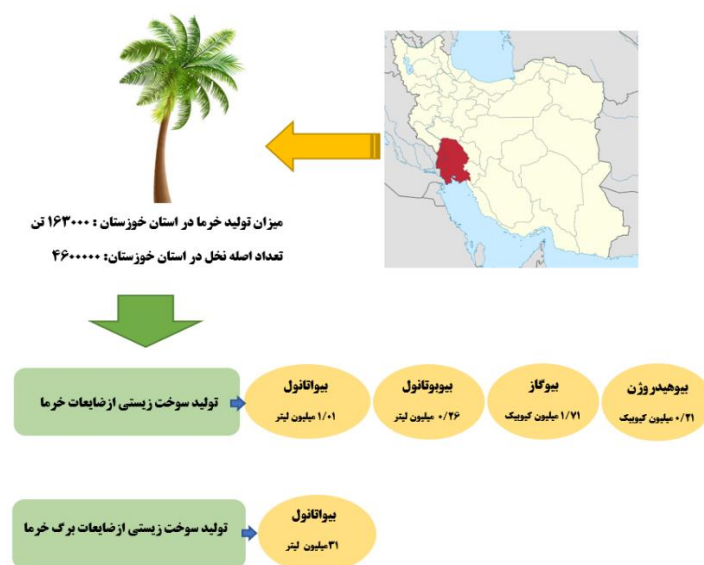
شکل ۲: میزان سوخت های زیستی بیواتانول، بیوگاز، بیوبوتانول و بیوهیدروژن بدست آمده از ضایعات درخت خرما در استان خوزستان

بر اساس محاسبات انجام شده به ازای ۴۶۰۰۰۰۰ اصله نخل موجود در استان خوزستان می توان سالانه به میزان ۳۱۲۸۰۰ تن برگ خرما که بصورت زایداتی است جمع آوری نمود که با احتساب ضریب جمع آوری ۵۰ درصد برای این محصول نیز می توان چیزی حدود ۱۵۶۰۰۰ تن سالانه در استان جمع آوری نمود. همچنین، با توجه به ضرایب بیان شده برای هسته خرما نیز می توان از ۱۶۳۰۰۰ تن خرما حدود ۴۸۹۰۰ تن بصورت ضایعاتی می توان بدست آورد که بر اساس ضرایب بیان شده در مقالات به سوخت های بیوگاز، بیواتانول، بیوبوتانول و همچنین بیو هیدروژن قابل تبدیل است. همچنین با فرض فرآوری این حجم خرما در استان بصورت کاملا مکانیزه می توان حدود ۴۸۹۰۰ تن هسته خرما نیز استحصال نمود که با در نظر گرفتن حدود ۱۰ درصد روغن برای این محصول نیز می توان برای تولید بیودیزل از آن بهره گرفت. میزان سوخت های زیستی بیواتانول، بیوگاز، بیوبوتانول و بیوهیدروژن بدست آمده از ضایعات درخت خرما در استان خوزستان در شکل (۲) نشان داده شده است.