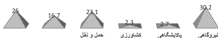
نمودار (۱) سهم هر یک از بخشهای مصرف کننده انرژی در انتشار کربن دی اکسید در سال ۱۳۹۰

می‌شود. بیشترین میزان انتشار کربن دی اکسید از نیروگاه گازی و بخار است که به ترتیب ۲۴/۵ و ۳۹/۹ درصد از تولید برق کشور از این نیروگاه‌ها بوده است. نیروگاه‌های سیکل ترکیبی نیز ۳۰/۳ در تولید برق سهم داشته‌اند [۲].