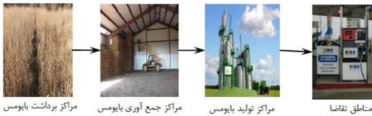
شکل ۱. ساختار زنجیره تامین سوخت زیستی

تعدادی از گزینه‌های تصمیم‌گیری و فعالیت‌های پی‌درپی از قبیل انتخاب زمین، کاشت و کوددهی، برداشت، حمل و نقل و تولید سوخت زیستی در این زنجیره وجود دارد و این تصمیمات از طریق زنجیره تامین مطرح و بررسی می‌شوند. گندم‌زار دارای بازه بالایی برای تولید بایومس است؛ با این وجود هزینه‌ی اجاره‌ی بالایی دارد. از طرفی زمان و روش کاشت به یکدیگر وابسته هستند. بنابراین نیاز است تا سناریوهای مختلف با هم در نظر گرفته شوند. برای فرآیند تصمیم‌گیری بهینه و بررسی تولید سوخت زیستی، نیاز است تا مدل‌های بهینه‌سازی یا سیستم‌های پشتیبان تصمیم‌گیری فشرده توسعه یابند.